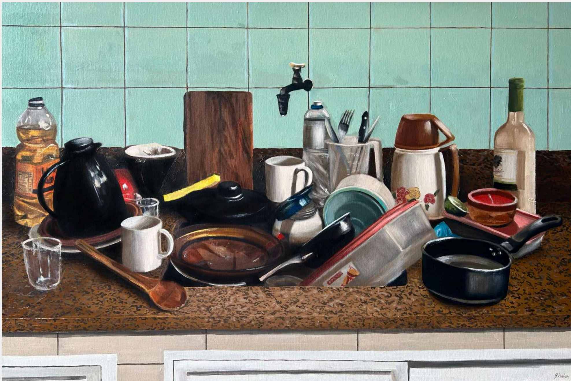
Louça suja inventada - Série: Cozinhas afetivas Óleo sobre tela, 60x90cm 2024