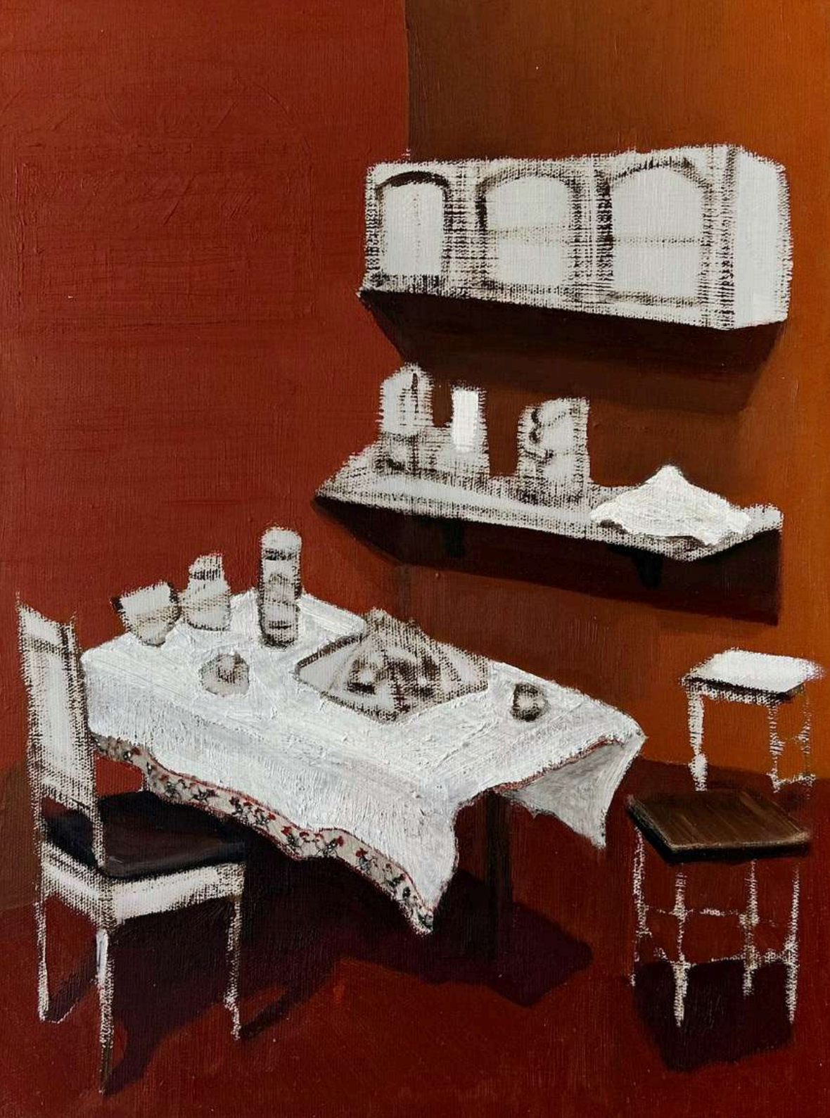
Utopia II - Série: Culpa da invisibilidade Óleo sobre tela, 40x30cm 2025