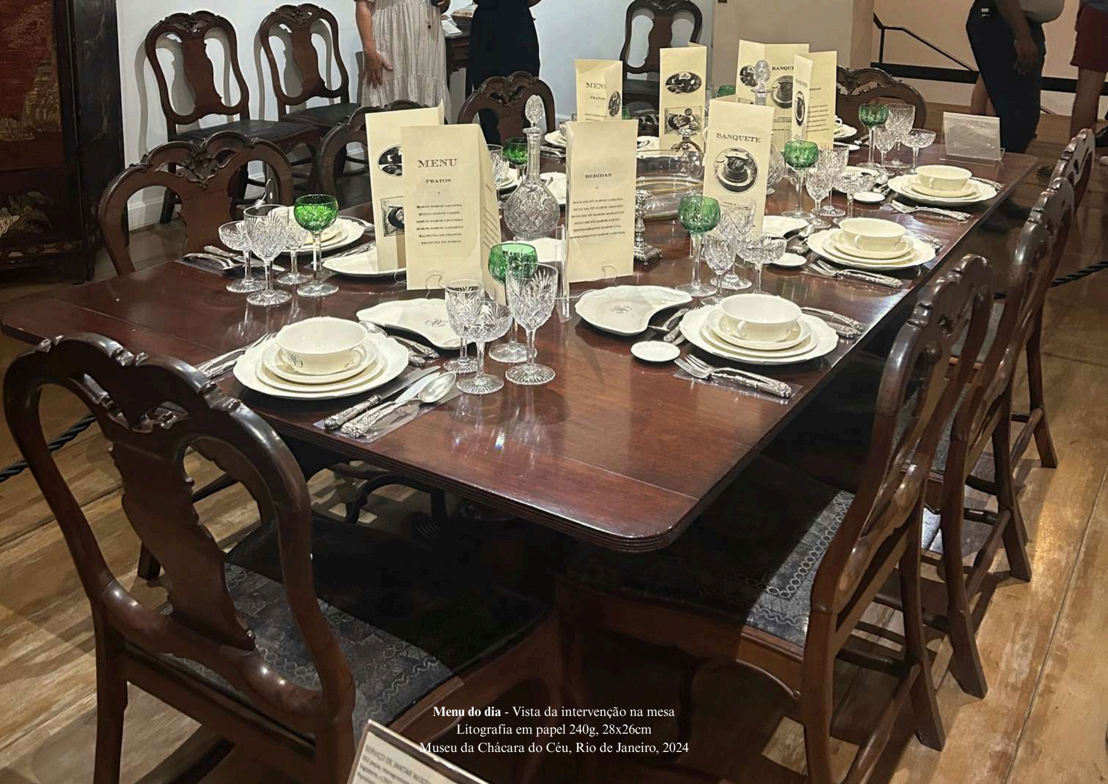
Menu do dia - Vista da intervenção na mesa Litografia em papel 240g, 28x26cm Museu da Chácara do Céu, Rio de Janeiro, 2024