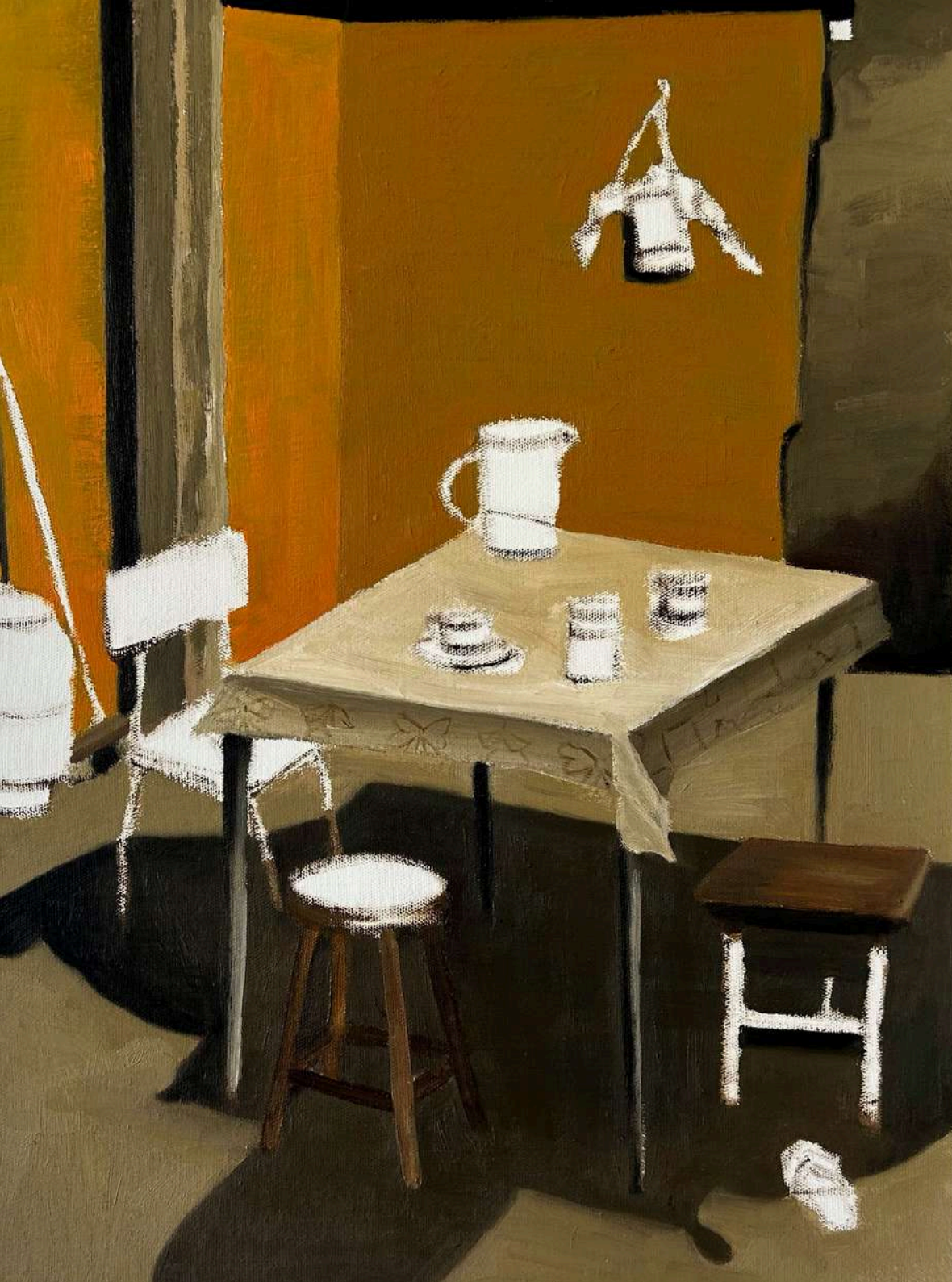
Utopia IV - Série: Culpa da invisibilidade Óleo sobre tela, 48x36cm 2025