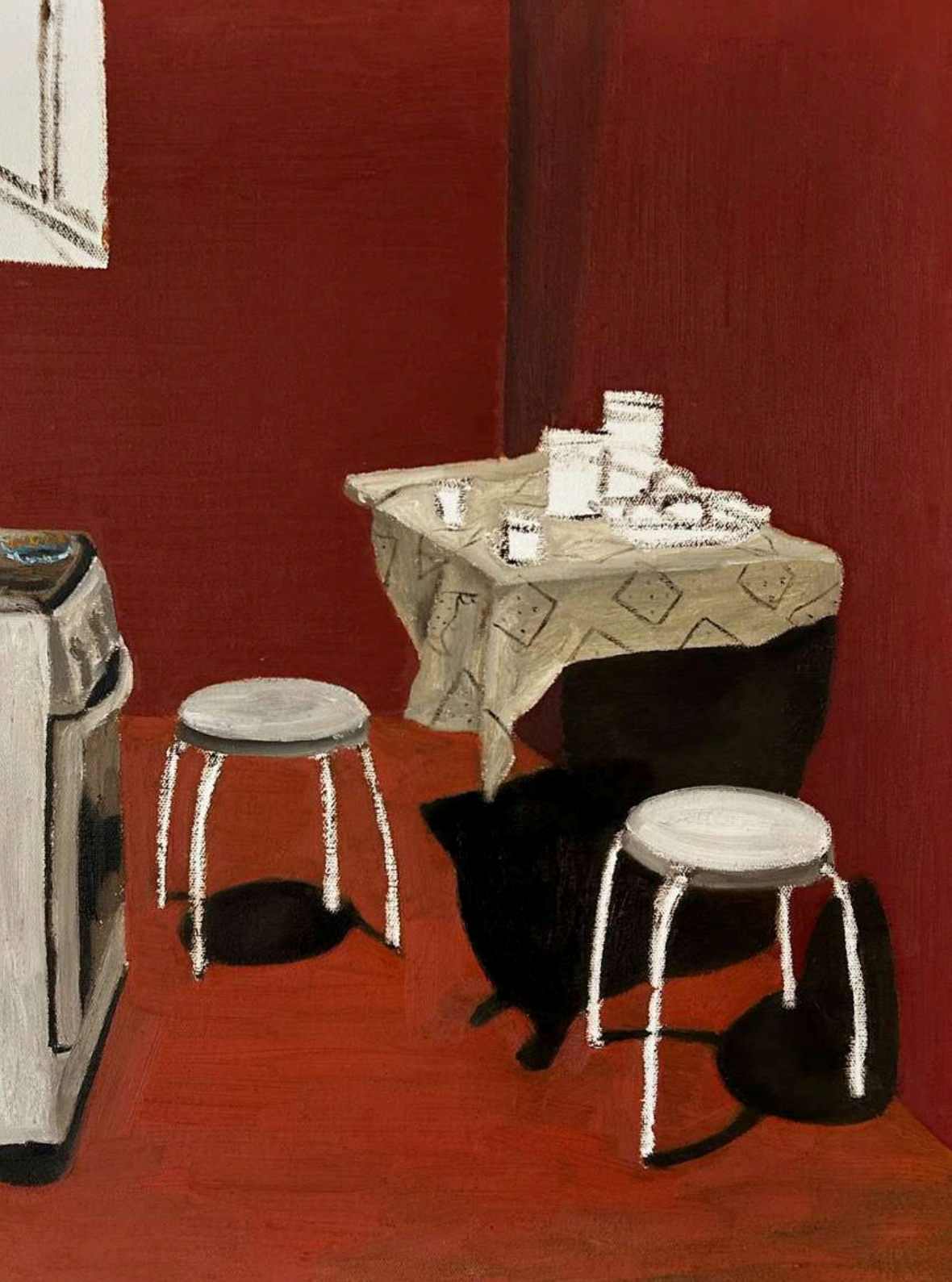
Utopia V - Série: Culpa da invisibilidade Óleo sobre tela, 48x36cm 2025