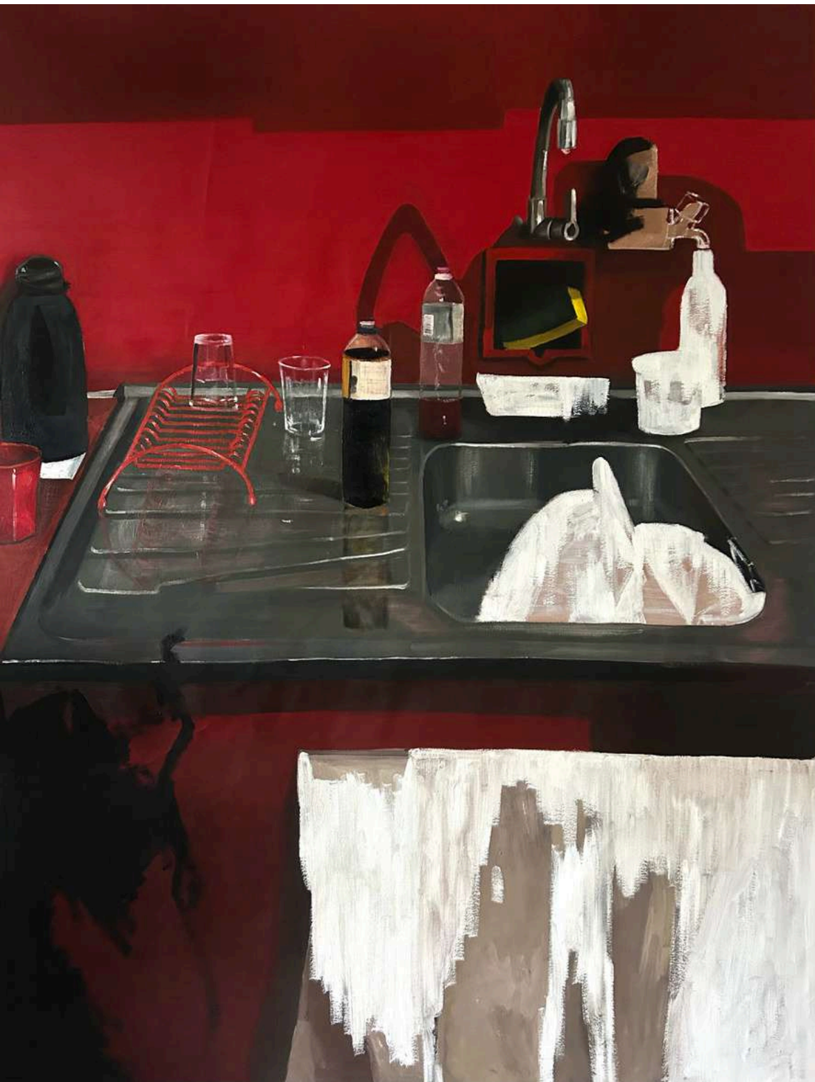
A fala da casa Óleo sobre tela, 150x120cm 2025