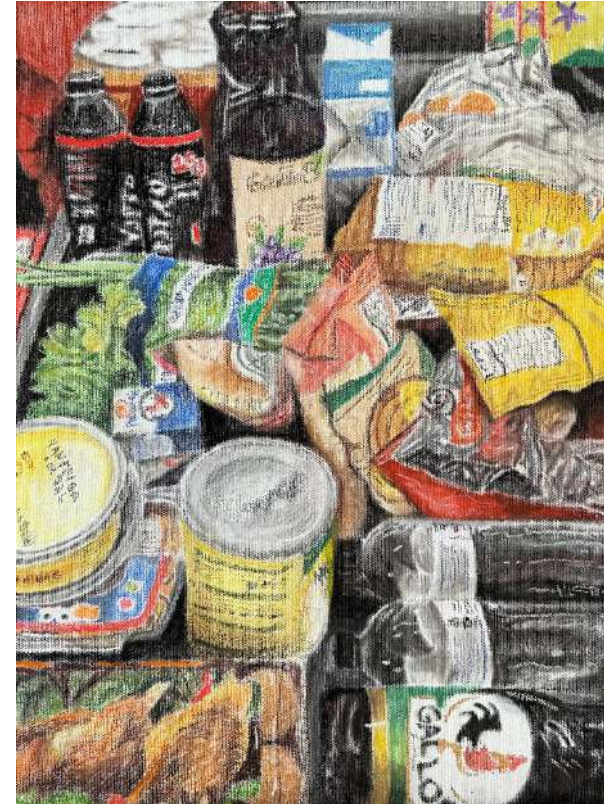
Compras do fim de semana, do mês, da semana Pastel seco sobre tela, tríptico, 40x90cm 2024