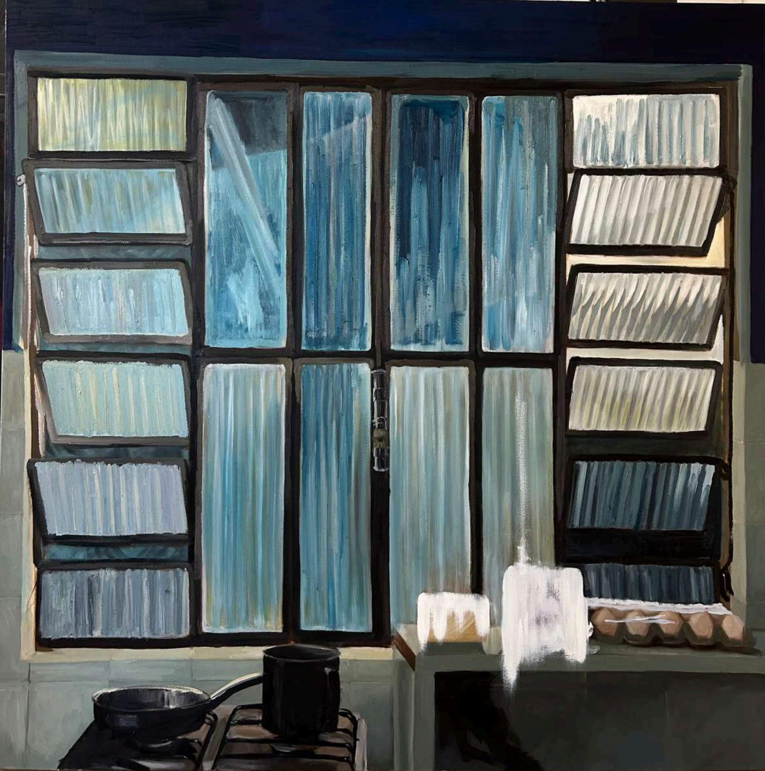
A partir do interior Óleo sobre tela, 130x130cm 2025