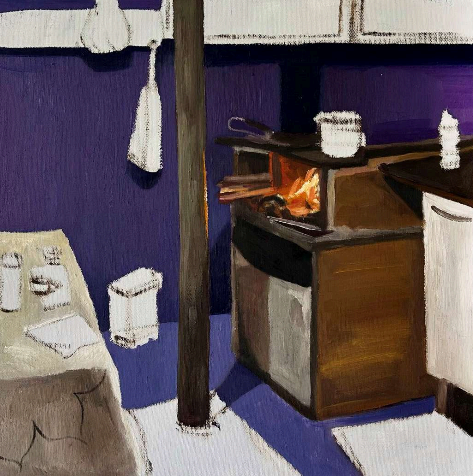
Utopia III - Série: Culpa da invisibilidade Óleo sobre tela, 40x40cm 2025