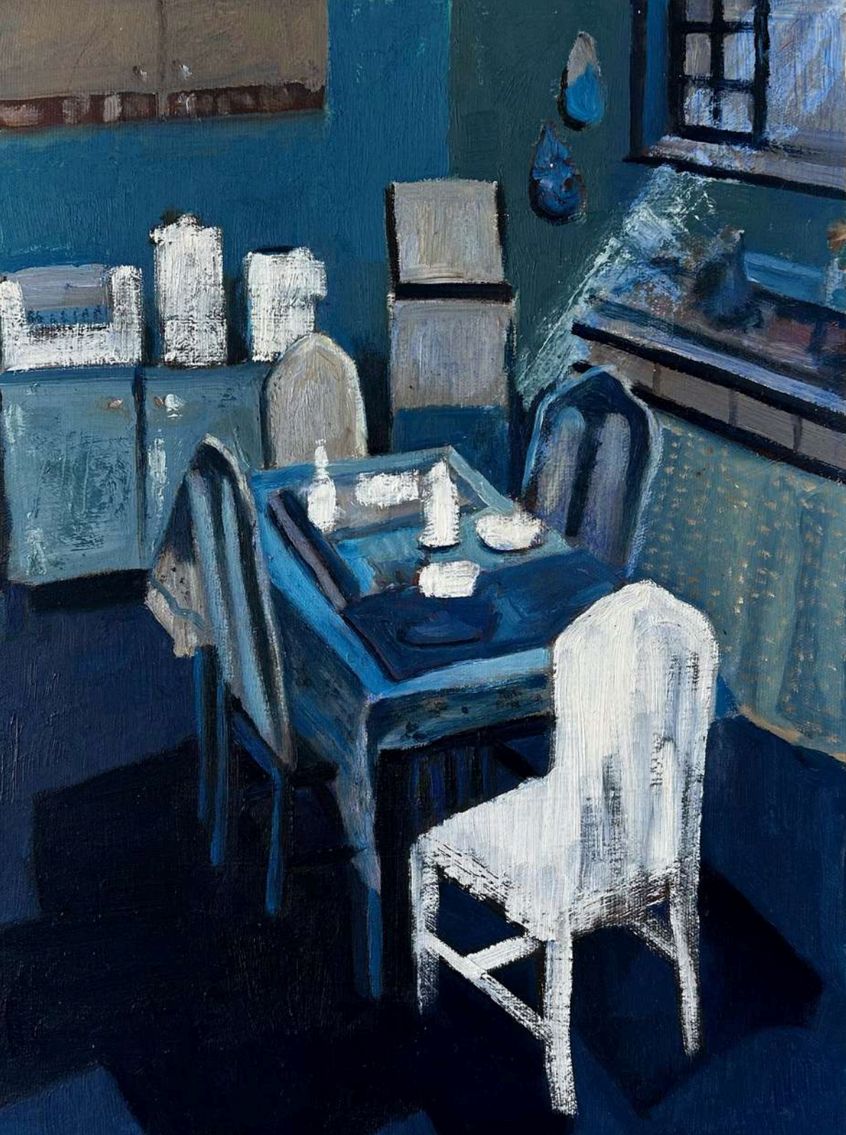
Utopia I - Série: Culpa da invisibilidade Óleo sobre tela, 40x30cm 2025