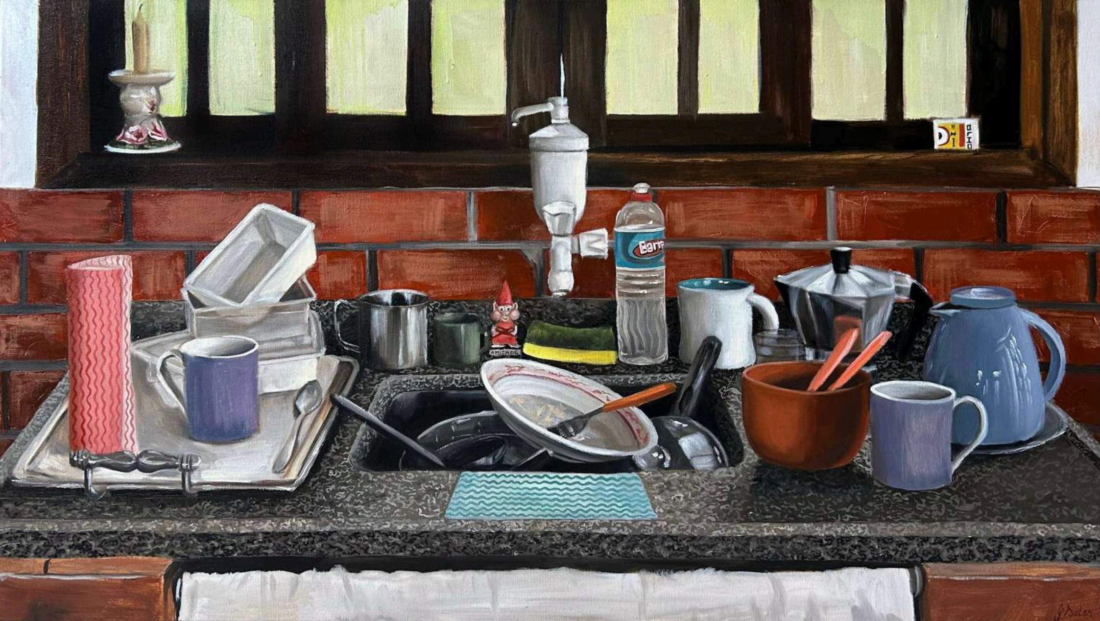
Vésperas do meu aniversário - Série: Cozinhas afetivas