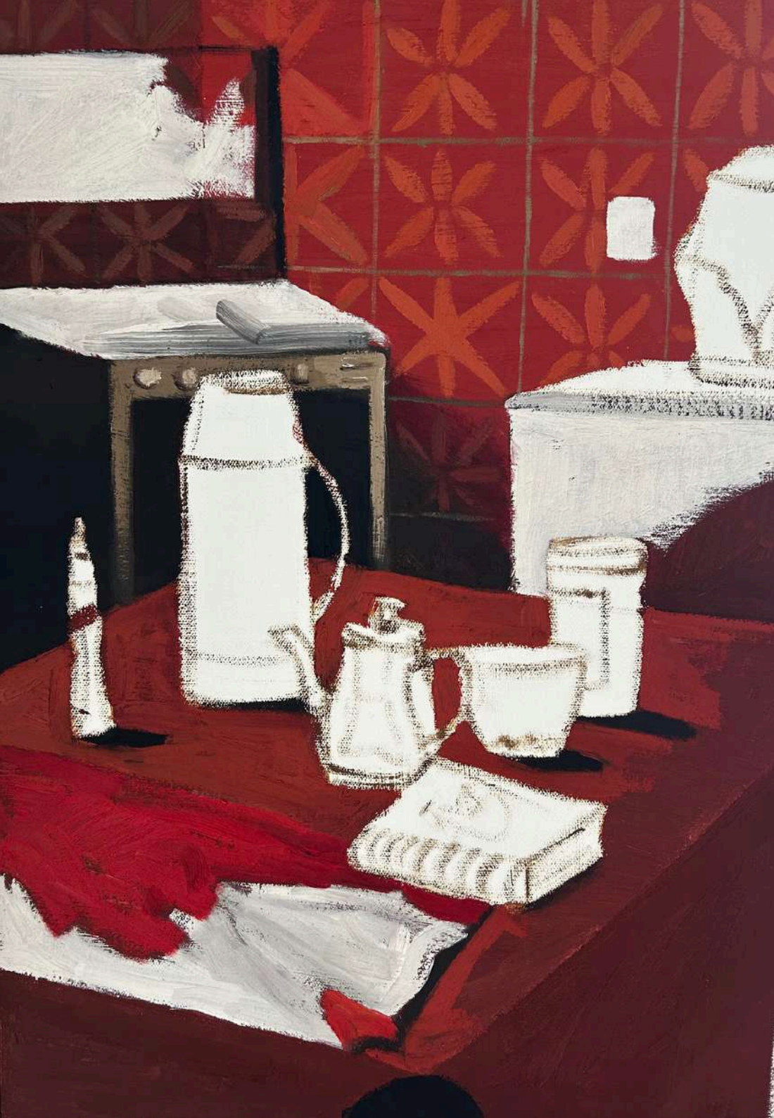
Eu já estive aqui Óleo sobre tela, 48x36cm 2025