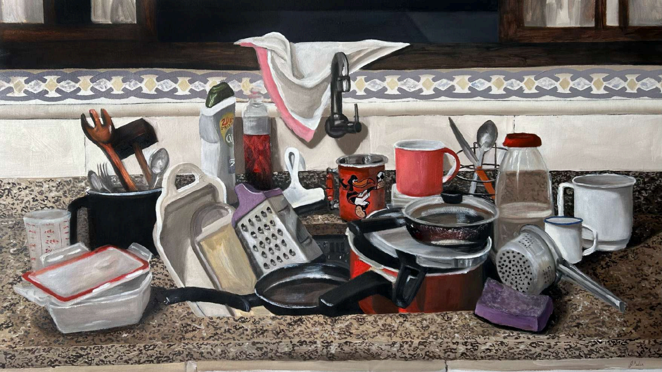
Louça suja da minha vizinha - Série: Cozinhas Afetivas