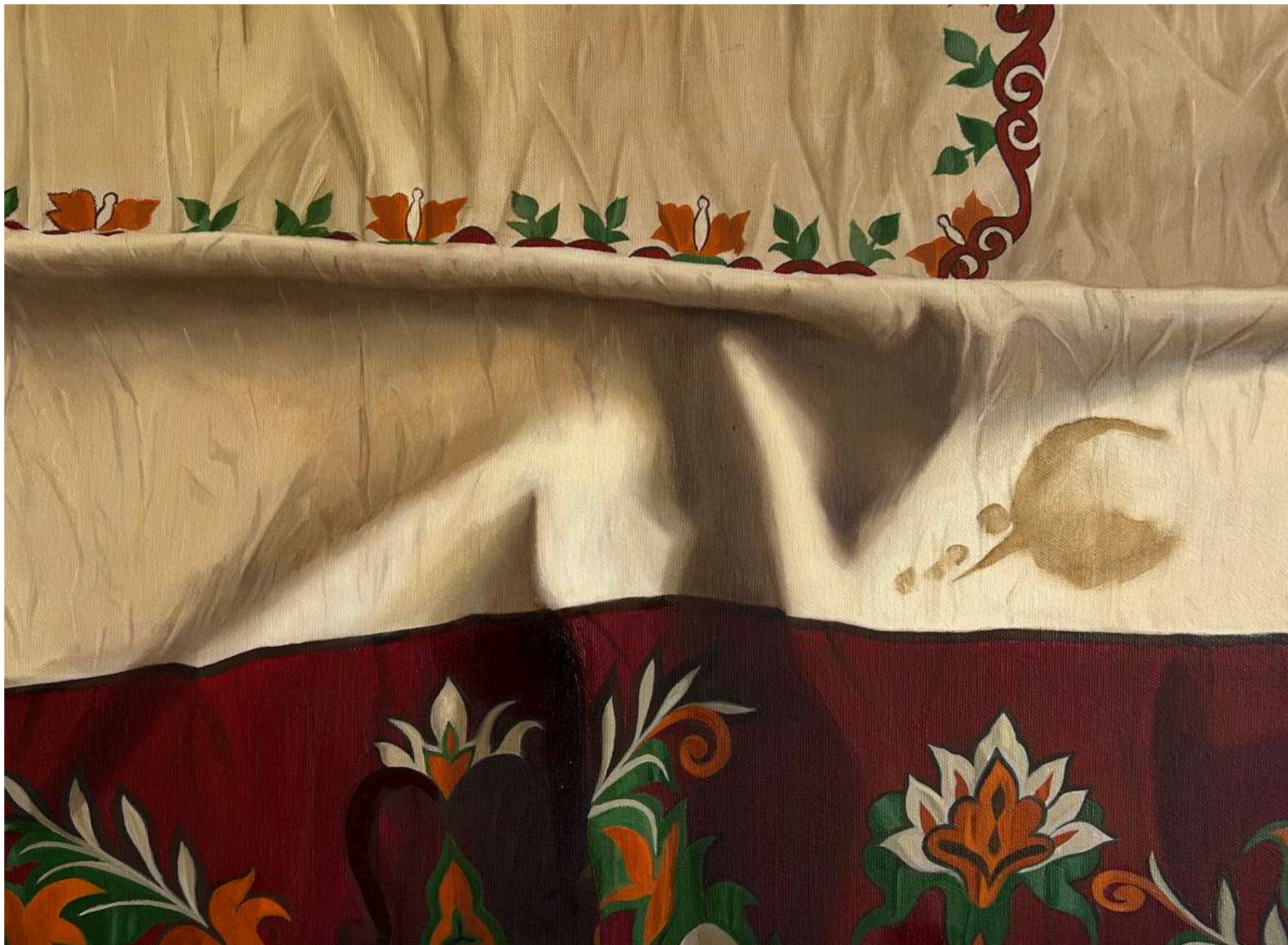
Sem título - Série: Faltou luz mas era dia Óleo sobre tela, 36x48cm 2026