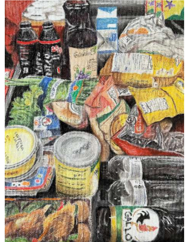
Compras do fim de semana, do mês, da semana Pastel seco sobre tela, tríptico, 40x90cm 2024