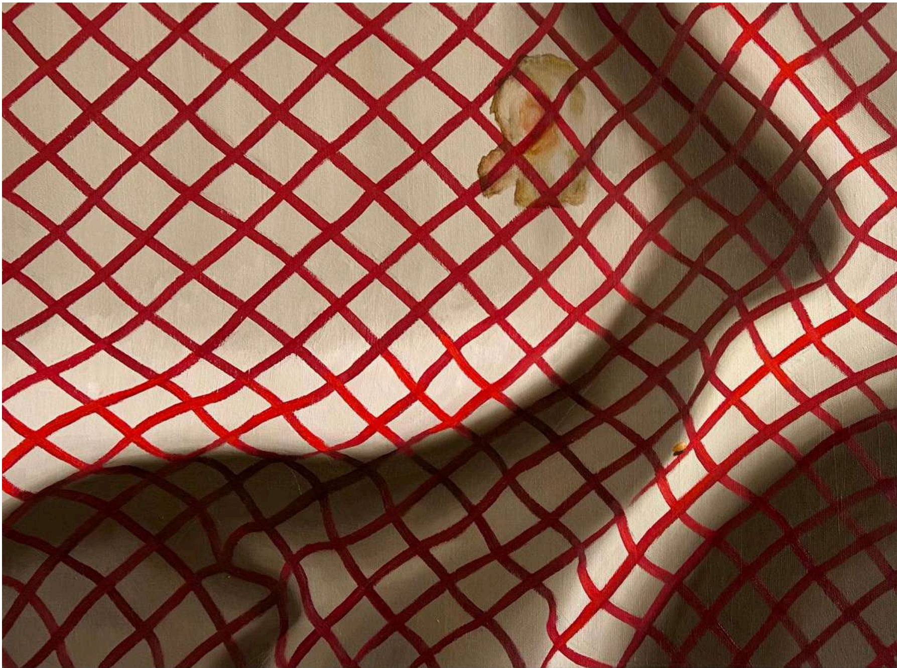
Sem título - Série: Faltou luz mas era dia Óleo sobre tela, 36x48cm 2026